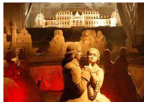
砂の美術館 - 第3期展示 - (夜)

鳥取砂丘市営駐車場周辺では「鳥取砂丘イリュージョン」も同時開催されますので、こちらも合わせてお楽しみ下さい。